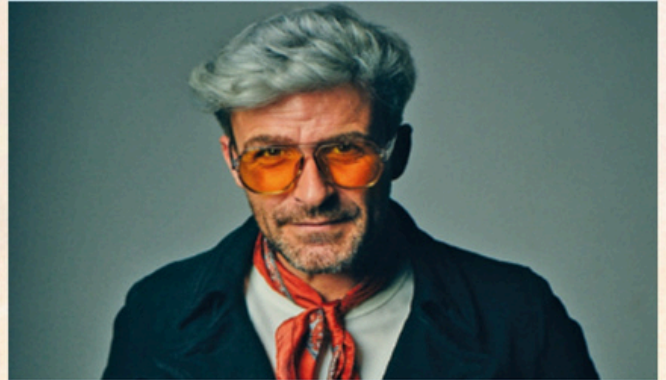
FUNAMBULISTA. Jueves 9, 23:00 h.