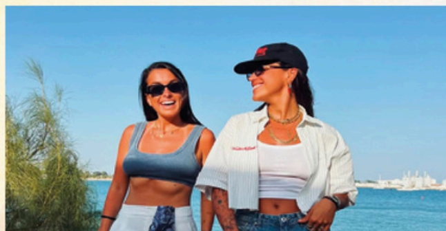
MARLENA. Domingo 12, 22:00h.

14:00 h. Juego de los chinos organizado por la ADCR Lemans en la Plaza de Extremadura.