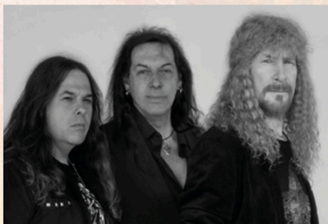
MEDINA AZAHARA. Viernes 10, 21:00 h.

18:00 h. Concierto "Hispanidad" Orquesta sinfónica infantil y juvenil Kuyayky (Jauja). Salón de actos Hospital Universitario José Germain (antigua capilla). C/Luna nº1. Orgnaizan: Fundación Kuyayky y Ayuntamiento de Leganés.