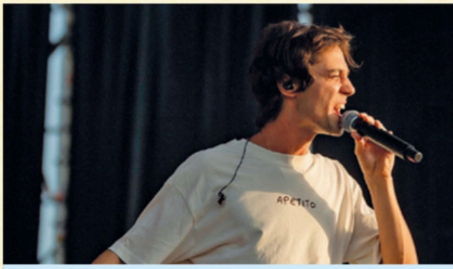
HEY KID. Sábado 11, 21:00 h.

11:00 h. Ven a jugar al tenis organizado por Kids and Us y el Club de Tenis Alborada en el Polideportivo Julián Montero.